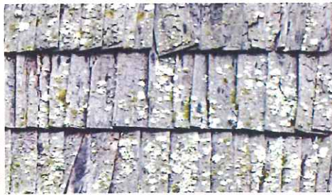
苔・藻の発生 水分を含んだ屋根材に苔や藻が発生