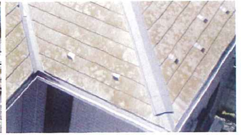
白亜化 (チョーキング) 屋根に白い粉のようなものが浮く