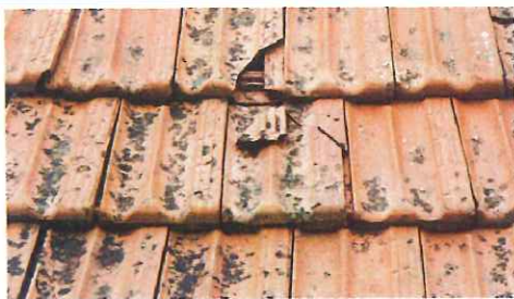
ひび割れ 屋根材が割れたり、欠ける

劣化した状態を放置し続ければいずれは躯体の劣化につながり、リフォーム費用が高額になることも! 早めのメンテナンスや屋根リフォームをおすすめします。